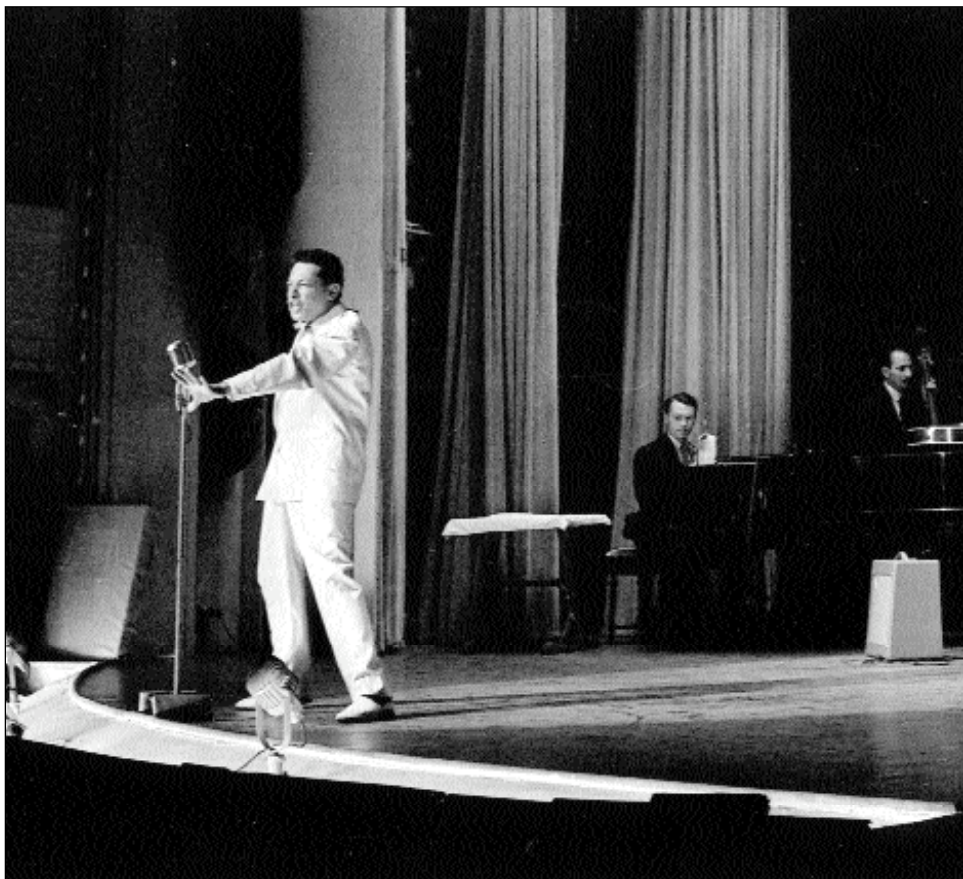
Henri Salvador sur scène en 1956.

C'est alors qu'il se produit à l'A.B.C. qu'Henri va faire la connaissance d'un jeune inconnu, récemment arrivé en France, originaire d'Alexandrie comme Jacqueline... Georges Moustaki, qui essaye de placer ses chansons, vient frapper à la porte de la loge d'Henri.